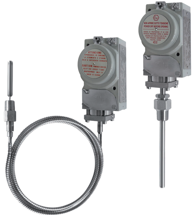
Fig. sinistra: Termostato, modello TCS-C Fig. destra: Termostato, modello TCS-B